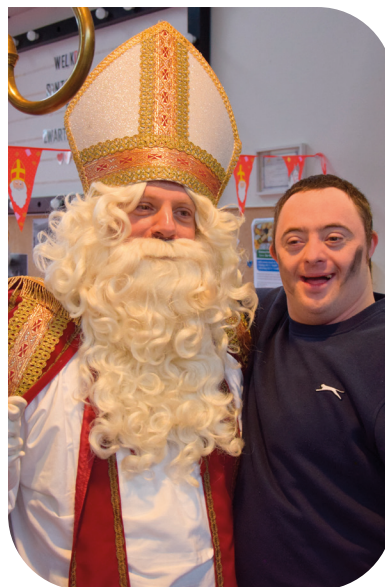
Sinterklaas op De Witte Mol