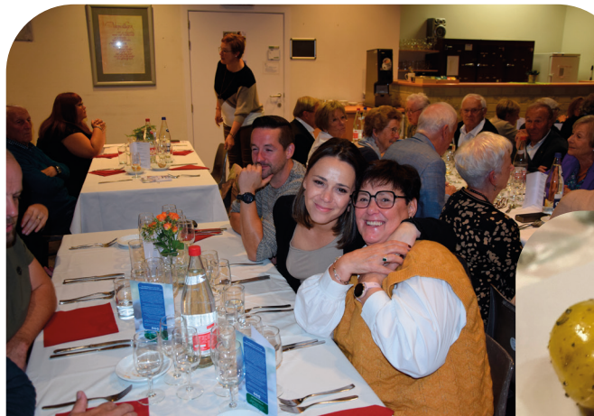
Lees meer over de gastronomische wijnhappening op blz. 18