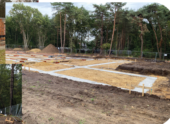
Meneer Miel in aanbouw meer lees je hierover op p. 10