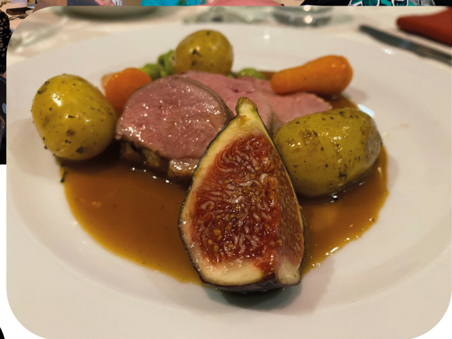
Lees meer over het vrijwilligersfeest op blz. 16